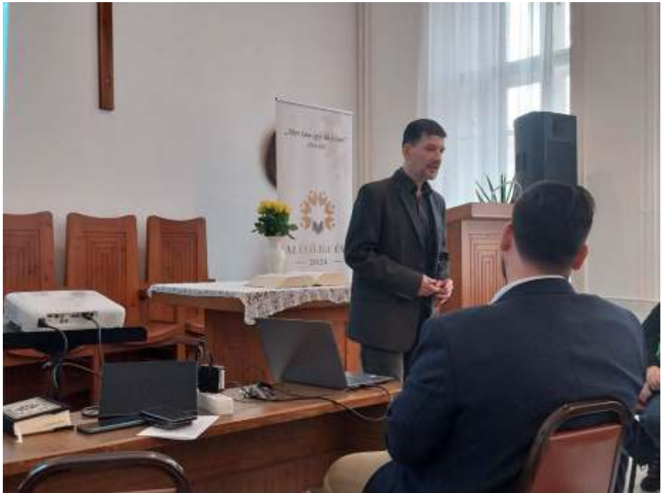
Egyházmegyei diakóniai csendesnap, Horváth Imre előadása