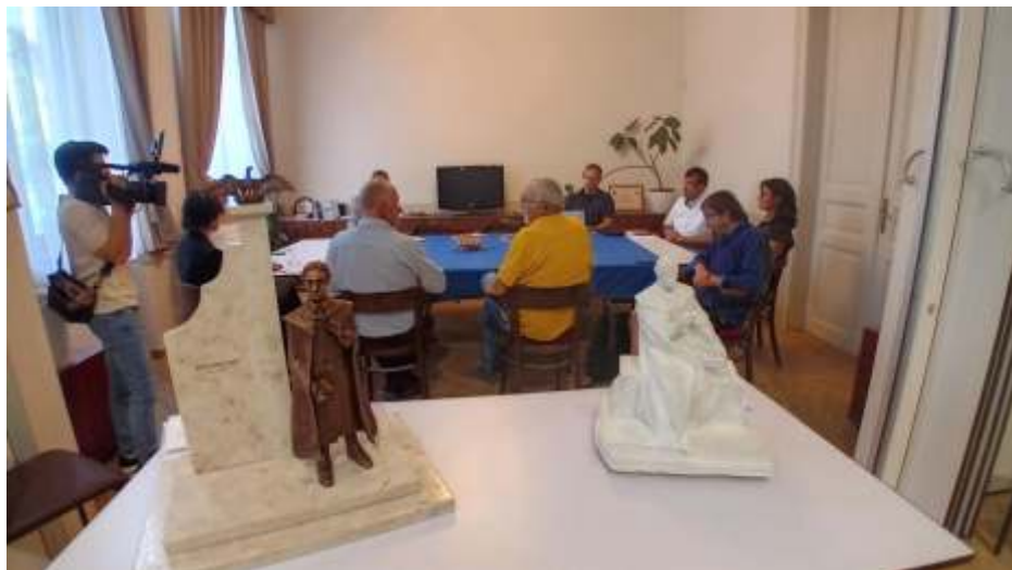
Nagytemplom 200 emlékbizottsági ülés augusztus 25-én az imaházban