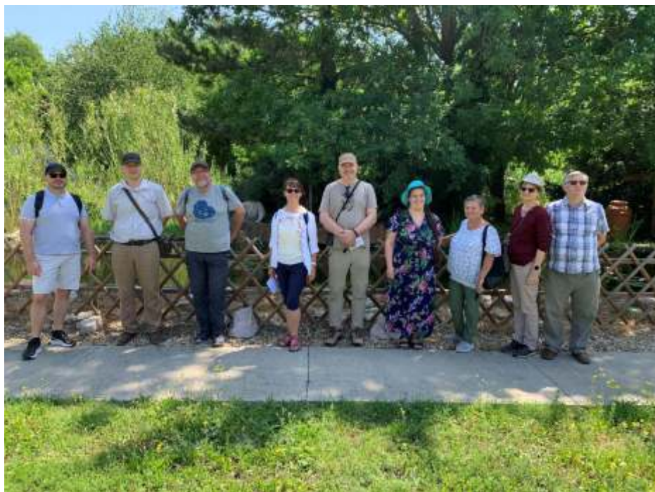
Gyülekezeti kirándulás Szarvasra, június 14-én